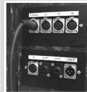
3. Xi Points fejn jitqabbad microphone jew hrug mill-amplifier

Saret Hearing Loop-System maċ-ċinta tal-knisja kollha biex tiffaċilita smiegħ għal min juża apparat li jgħin li min hu nieqes mis-smiegħ.