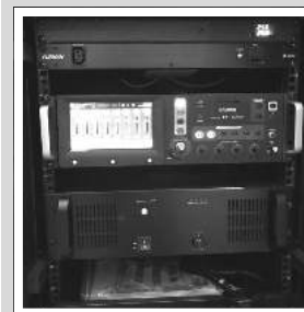
1. Yamaha TF series TF Rack mixer with automixing

Wara diversi stimi li ngabru, rajna li l-proposta li għamlu Genaudio Ltd kienet waħda pjuttost tajba. Għalhekk bejn it-Tnejn 4 u s-Sibt 16 ta' Ġunju 2018, inbeda l-proċess ta' wiring ġdid tul il-knisja kollha kif ukoll l-installazzjoni ta' Corneredaudio Ci4V speakers , inkluż 8 godda: 2 fil-kor, 2 fil-kappelluni, 2 fuq l-orgni u 1 fuq iċ-ċinta jħares lejn l-altar, kif ukoll dak ta' barra. Inbidlu wkoll l-amplifier l-antik ma' Yamaha TF series TF Rack mixer with automixing , il-microphones kollha li saru Clockaudio microphones , żdiedu aktar cordless , u saru aktar points fejn jitqabbad microphone jew hrug mill-amplifier.